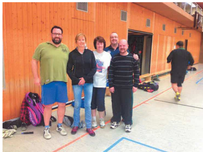
Auswärtsspiel in Güls 3 „zu fünft“