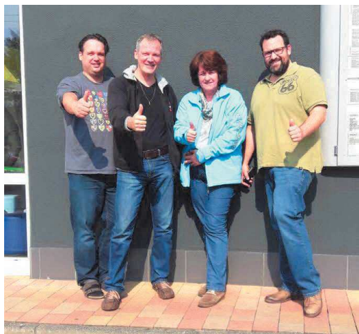
Auswärtsspiel gegen Horhausen 3 „nur zu viert“